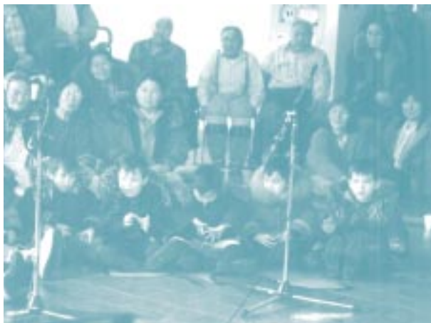
ᐅᓂᓂᓂᓂᓂ ᐅᓂᓂᓂᓂᓂᓂ, ᐅᓂᓂᓂᓂᓂ Iqitauvik Day Care, Kuujuuaq

Jiisusiup nallinninga angjuq O angjua luuk.”